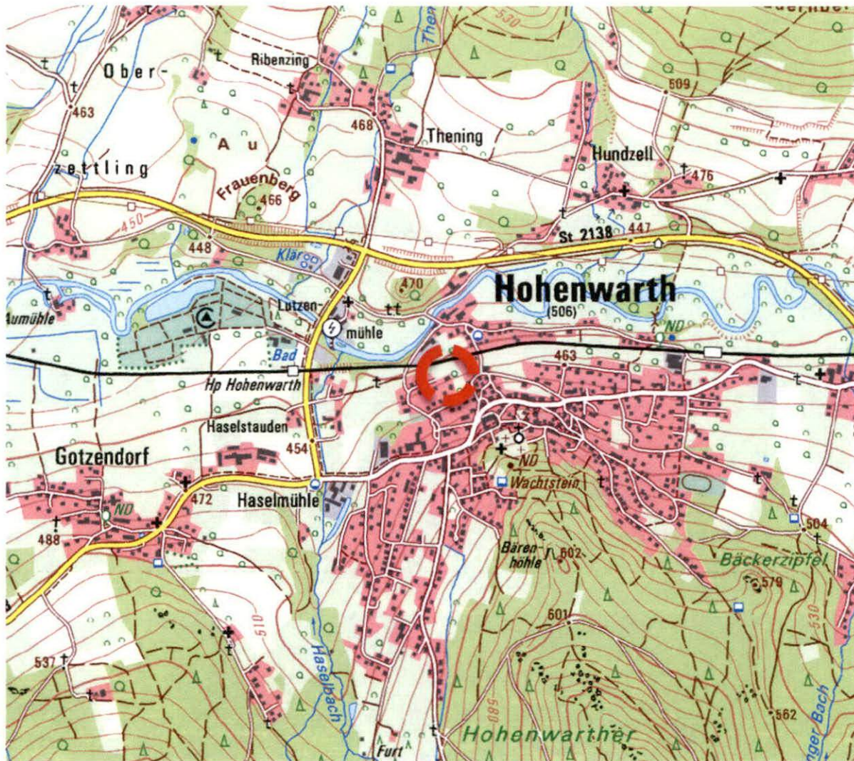
Topografische Karte (DTK25) mit Lage des Geltungsbereiches (rot), o.M.